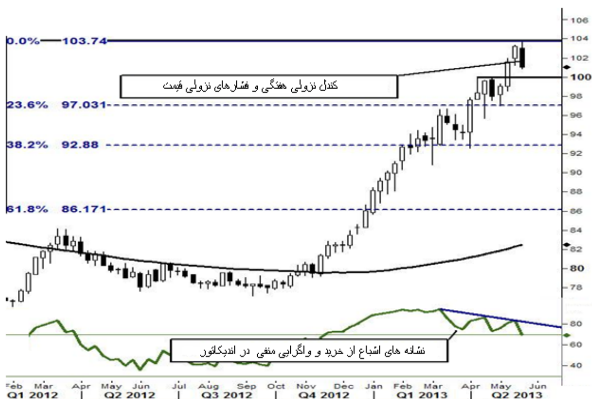
نمودار روند تغییرات هفتگی زوج ارز دلار آمریکا - ین ژاپن

در زوج EurJpy نیز از نحوه چینش سفارشها می توان متوجه شد که این هفته احتمالا قیمت بالاتر از منطقه ۱۳۲۰۲۰ و ۱۳۲۰۵۰ نمی آید و نهایت افزایش تا همین سطح ۱۳۲۰۵۰ است و احتمالا کاهش قیمت پس از آن محتمل است و ۱۳۰۰۳۰ و سپس ۱۳۰۰۰۰ دوباره با چالش روبرو خواهند شد. سطوح حمایت نیز در منطقه ۱۲۹۰۶۰ الی ۱۲۹۰۲۰ تشکیل شده اند. در زوج GbpJpy منطقه سقف قیمت که این هفته اکثر سفارشات فروش چیده شده است در منطقه ۱۵۵۰۰۰ الی ۱۵۵۰۵۰ و منطقه کف یا حمایت قیمت در محدوده ۱۵۱۰۵۰ الی ۱۵۱۰۰۰ قرار گرفته است. ازین رو همبستگی بالایی میان شاخص داوجونز آمریکا و ین ژاپن بوجود آمده است و قوی شدن ین نیز در هفته ی گذشته به همین علت بوده است.