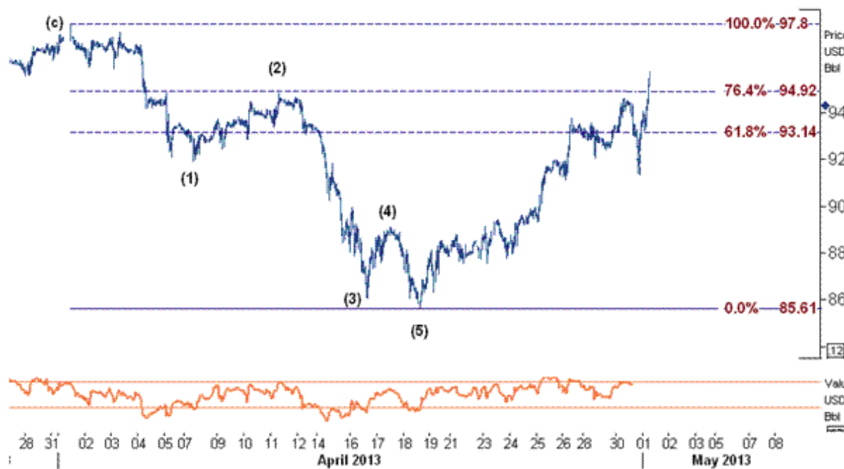
نمودار روند تغییرات ۱ ساعته قیمت نفت خام سبک آمریکا

همانگونه که در تحلیل های سایت گفته ایم طبق قوانین سطوح فیبوناچی با شکست سطح ۹۴.۹۲ بایستی به انتظار افزایش تا سطح ۹۷.۸۰ باشیم. همچنین متذکر شدیم که با توجه به نوسانات بسیار زیاد نفت و اینکه این کالا بیشتر تحت تاثیر عوامل فاندامنرال و تکنیکال می باشد بایستی در ورود به بازار دقت زیادی نمایید. به نظر هدف مورد اشاره شده با توجه به شکست سطح ۹۴.۹۲ قابل دسترس می باشد و می بایست در انتظار افزایش قیمت نفت سبک آمریکا به ۹۷.۸۰ باشیم.