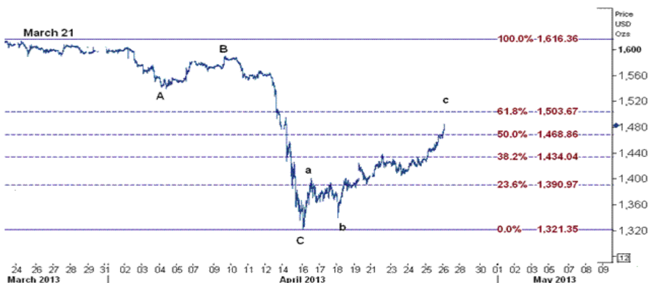
نمودار روند تغییرات ۱ ساعته قیمت جهانی اونس طلا