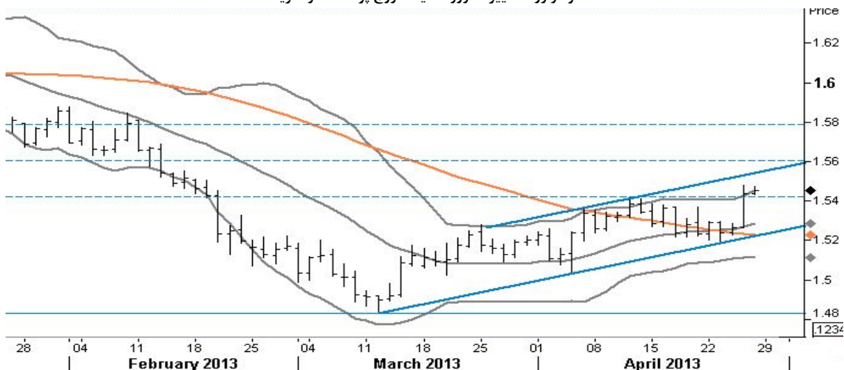
نمودار روند تغییرات روزانه قیمت زوج پوند - دلار آمریکا

اگر حرکت صعودی ، قادر به شکستن سطح ۱۵۳.۸۵ (بالاترین سطح روز ۱۱ آوریل) و تثبیت قیمت در بالای آن گردد، هدفهای بعدی به ترتیب سطوح ۱۵۶.۸۰ (بالاترین سطح روز ۲۰ اوت سال ۲۰۰۹) و بعدی سطح ۱۵۷.۵۵ (بالاترین سطح روز ۱۹ اوت سال ۲۰۰۹) خواهد بود. در حرکت نزولی نیز اگر فروشندگان وارد معامله شوند و قیمت به زیر سطح ۱۵۰.۱۱ (خط تانکان در اندیکاتور اِچیموکو) و سطح روانی ۱۵۰.۰۰ سقوط کند، می توان به انتظار کاهش تا هدف ۱۴۸.۸۴ و ۱۴۷.۱۰ (خط کیجون در اندیکاتور اِچیموکو) را داشت .