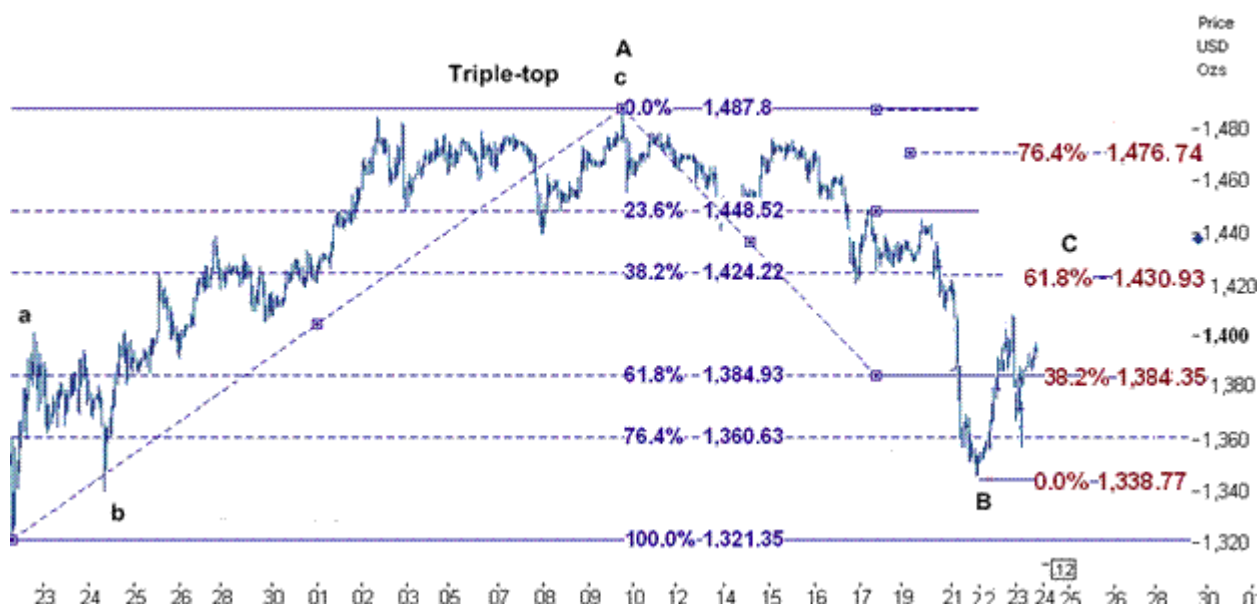
نمودار روند تغییرات روزانه قیمت جهانی اونس طلا