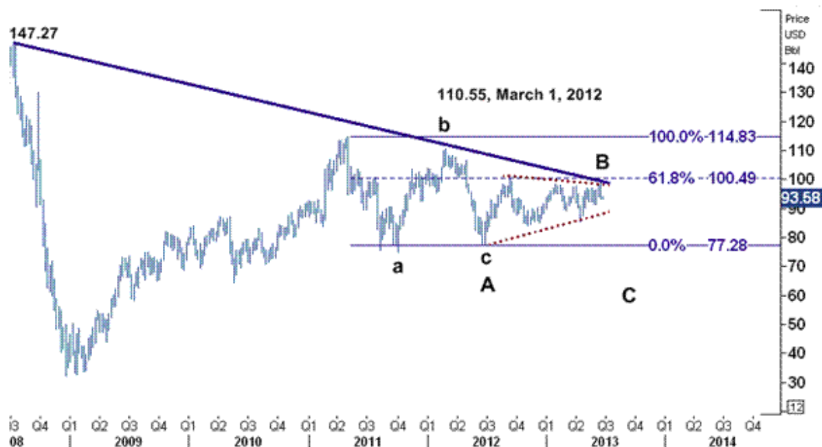
نمودار روند تغییرات هفتگی قیمت نفت خام سبک آمریکا

در هر صورت در نمودار زیر کاملاً مشخص است که موج B در الگوی گوه شکل گرفته است و از آنجایی که پس از روند نزولی این شکل بوجود آمده است در این الگو سیگنال نزولی برای قیمت نفت خام در کوارتر سوم سال ۲۰۱۳ صادر کرده است. در حال حاضر قیمت نفت خام سبک آمریکا در موج بزرگ نزولی C قرار گرفته است که برای ۱ الی ۳ ماهه آینده انتظار داریم در این موج تمام آن چیزی را که در موج B بدست آورده بود از دست دهد و به نرخهای پایین ۸۵٫۶۱ و حتی ۷۷٫۲۸ دلار/ بشکه سقوط کند .