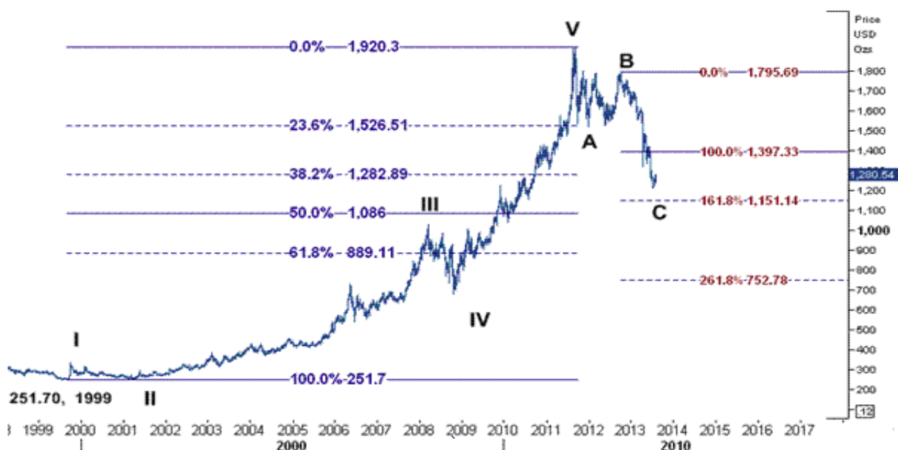
نمودار روند تغییرات هفتگی قیمت جهانی اونس طلا

بنابراین چنانچه آمار این هفته از اقتصاد آمریکا، بهبود وضعیت بازار کار و شرایط اقتصادی این کشور را نشان دهد، نگرانی ها از اقدام آتی بانک فدرال رزرو برای کاهش میزان نقدینگی و خروج زود هنگام از استراتژیهای مرتبط با سیاستهای انبساطی کمی ( QE ) و کاهش میزان برنامه خرید اوراق قرضه بیشتر می شود که این امر به تضعیف قیمت جهانی اونس طلا می انجامد اما از سوی دیگر اگر روز جمعه شاخص اشتغال آمریکا ضعیف تر از حد پیش بینی ها اعلام شود به نفع قیمت اونس طلا خواهد بود و صعود قیمت به بالای سطح مقاومت ۱۲۵۵ می تواند راه را برای حرکت صعودی تا رسیدن قیمت به محدوده ای ۱۲۷۰ و ۱۳۰۰ دلار هموار کند.