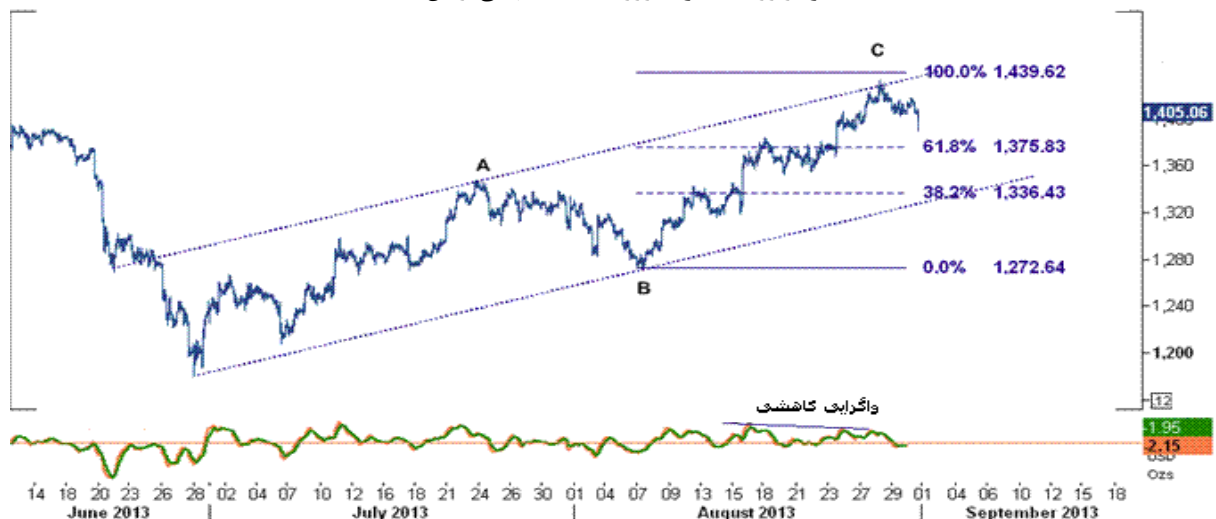
نمودار روند تغییرات روزانه قیمت جهانی اونس طلا