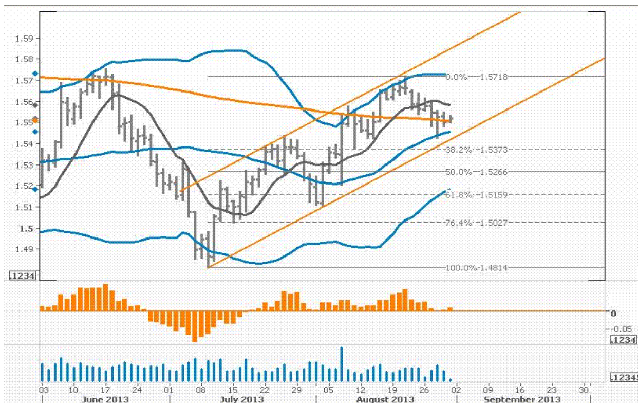
نمودار روند تغییرات روزانه زوج ارز پوند - دلار آمریکا

با تثبیت هفتگی قیمت در زیر سطح ۱.۵۵۰۷ ( خط میانگین متحرک ۲۰۰ روزه ) می توان انتظار داشت که این هفته حرکت کاهشی به سوی کف کانال ادامه یابد. با توجه به اینکه هم اکنون شاخص دلار آمریکا به بالای ۸۲ رسیده و بازدهی اوراق ۱۰ ساله نیز رو به افزایش است این موضوع به فشارهای نزولی پوند منجر خواهد شد و شکسته شدن سطح ۱.۵۴۲۷ می تواند قیمت را تا سطح حمایت ۱.۵۴۱۸ و ۱.۵۴۰۰ پایین بکشد. بنابراین معامله گران همچنان کنترل اصلی فروش این زوج را در دست دارند و قیمت در معاملات روز جمعه پایین خط میانگین متحرک ۲۰۰ روزه بسته شد و همانطور که در نمودار زیر شاهد هستیم این زوج ارز در حال پول بک (pullback) و برگشت به سوی کف کانال در مسیر کاهشی می باشد و چنانچه این هفته سطوح مقاومت ۱.۵۵۵۰ و ۱.۵۵۶۰ الی ۱.۵۵۹۰ دست نخورده باقی مانند باید برای زوج پوند- دلار در انتظار کاهشی دیگری تا کف کانال یعنی حدود ۱.۵۴۱۸ باشیم.