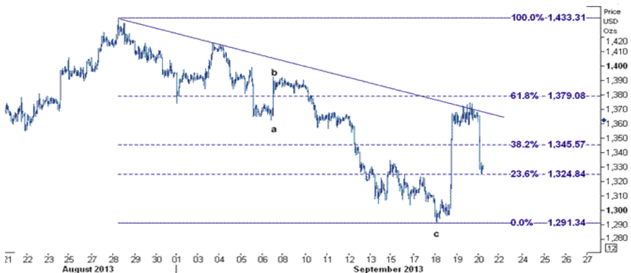
نمودار روند تغییرات ۱ ساعته قیمت جهانی اونس طلا