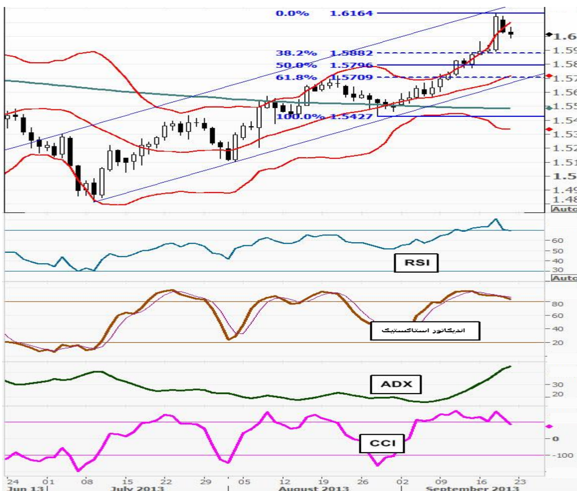
نمودار روند تغییرات روزانه زوج ارز پوند - دلار آمریکا

پوند بخشی از حرکت افزایشی این هفته در معاملات روز پنجشنبه و جمعه را به خاطر آمار ضعیف خرده فروشی انگلیس اصلاح کرد و اندکی کاهش یافت اما این حرکت نتوانست از سطح حمایت ۱.۵۹۸۰ عبور کند و در هفته جاری پتانسیل حرکت افزایشی قیمت همچنان وجود دارد. سطوح حمایت به ترتیب در ۱.۵۹۸۰، ۱.۵۹۵۰، ۱.۵۹۰۰ و ۱.۵۸۹۳ الی ۱.۵۸۸۶ و ۱.۵۸۶۹ قرار دارند و انتظار می رود بار دیگر قیمت برای عبور از سطح مقاومت ۱.۶۰۸۰ و ۱.۶۱۰۰ تلاش کند. ولی شروع حرکت افزایشی تنها زمانی ممکن خواهد بود که قیمت به بالای ۱.۶۱۱۰ صعود کند. از نظر فاندامنتالی نیز این امکان وجود دارد که با توجه به اعلام جزئیات صورت جلسه نشست پیشین بانک مرکزی انگلیس و همچنین آمارهای اخیر اقتصادی (به جز شاخص خرده فروشی روز پنجشنبه) که چشم انداز نسبتاً روشنی از آینده وضعیت نرخ بهره انگلیس نمایان ساخته است به باور ما تاکید و تمرکز مباحث به افزایش آتی نرخ بهره انگلیس، می توان حرکت صعودی پوند را پیش بینی کرد. بنابراین انتظار برای افزایش نرخ بهره بانکی انگلیس در اواخر سال آینده، به پوند امکان تقویت بیشتر خواهد داد و خصوصاً انتظار می رود با بیشتر شدن اختلاف نرخ بهره بانکی بین انگلیس - آمریکا، پوند بیش از سایر ارزها در مقابل دلار آمریکا تقویت شود. هر چند که باید همچنان انجام یک حرکت اصلاحی برای زوج پوند - دلار را حتماً مد نظر داشت ولی اخبار مهم هفته جاری از اقتصاد آمریکا (ضریب اطمینان مصرف کنندگان، سفارشات کالاهای بادوام، فروش خانه های جدید، مدعیان بیمه بیکاری هفتگی، فروش خانه های معوقه) را پیگیری کنید و در صورت اعلام ضعیف آمارهای اقتصادی آمریکا، منتظر واکنش مثبت پوند باشید.