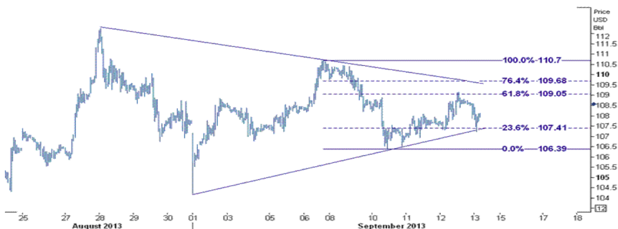
نمودار روند تغییرات ۱ ساعته قیمت نفت خام سبک آمریکا

در حرکت صعودی نیز در صورتیکه قیمت بتواند به بالای سطح ۱۰۹.۰۵ برسد انتظار افزایش زیادی را نداریم زیرا سطح مقاومت بعدی که می تواند جلوی هر گونه افزایش قیمت را بگیرد در محدوده نزدیکی سطح ۱۰۹.۶۸ قرار گرفته است. بنابراین هر چند که در معاملات روز جمعه شاهد افزایش قیمت پس از برخورد به سطح ۱۰۷.۴۱ بودیم اما انتظار داریم برای این هفته با ادامه کاهش تنش در خاورمیانه ، نشانه هایی از شروع دوباره حرکت نزولی به سوی ۱۰۷.۴۱ دلار/بشکه و حتی پایین تر دیده شود.