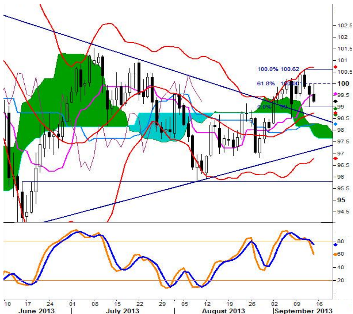
نمودار روند تغییرات روزانه زوج ارز دلار آمریکا - ین ژاپن

در اواخر هفته گذشته بار دیگر مشخص شد که در زوج دلار-ین ژاپن سطح مقاومت ۱۰۰ قابل نفوذ نیست و بدین ترتیب، در معاملات روز جمعه قیمت برابری در روندی نزولی قرار گرفت. در کوتاه مدت حرکت در روندی خنثی مابین نرخهای ۹۹.۰۰ و ۱۰۰ خواهد ماند، بنابراین، اگر در هفته جاری روند نزولی ادامه یابد، احتمال سقوط قیمت به زیر نرخ ۹۹.۰۰ وجود دارد که آن وقت می توان کاهش قیمت به سطوح ۹۸.۷۷ (خط میانگین متحرک ۲۱ روزه گذشته) یا سطح ۹۸.۲۸ (سقف ابر ایچیموکوی سبز رنگ) را پیش بینی کرد. در حال حاضر تمامی تحولات قیمت این زوج ارز می بایست بر روی نمودار روزانه دنبال شود زیرا عبور قیمت از سطح مقاومت ۱۰۰ (خط فیبوناچی ۶۱.۸ درصدی از ۱۰۰.۶۲ به ۹۹.۰۰) احتمالاً از سوی اندیکاتور استوکستیک تایید نشود زیرا اندیکاتور مذکور سیگنال نزولی صادر کرده است و تا زمانی که قیمت در زیر سطح مقاومت ۱۰۰ قرار دارد، احتمال کاهش به سطح ۹۹.۰۴ (خط میانگین متحرک ۱۰۰ روزه) و حتی نرخهای پایین تر وجود دارد. در حرکت نزولی نیز شکسته شدن قیمت ۹۹.۰۰ و ۹۸.۷۸ و سقوط به زیر ۹۸.۵۰ احتمال سقوط بیشتر قیمت تا نرخ ۹۸.۲۸ را بوجود خواهد آورد که این هدف بر روی سقف ابر ایچیموکوی قرار گرفته است. برای پایداری حرکت صعودی میان مدت نیز می بایست سطح حمایت ۹۹.۰۰ پایدار بماند و لازم است که قیمت با یک کندل روزانه بالای سطح ۱۰۰ بسته شود تا فرصتهای افزایشی مناسبی برای رسیدن به سطح ۱۰۰.۶۲ (بالترین سطح ۱۱ سپتامبر) تشکیل شود.