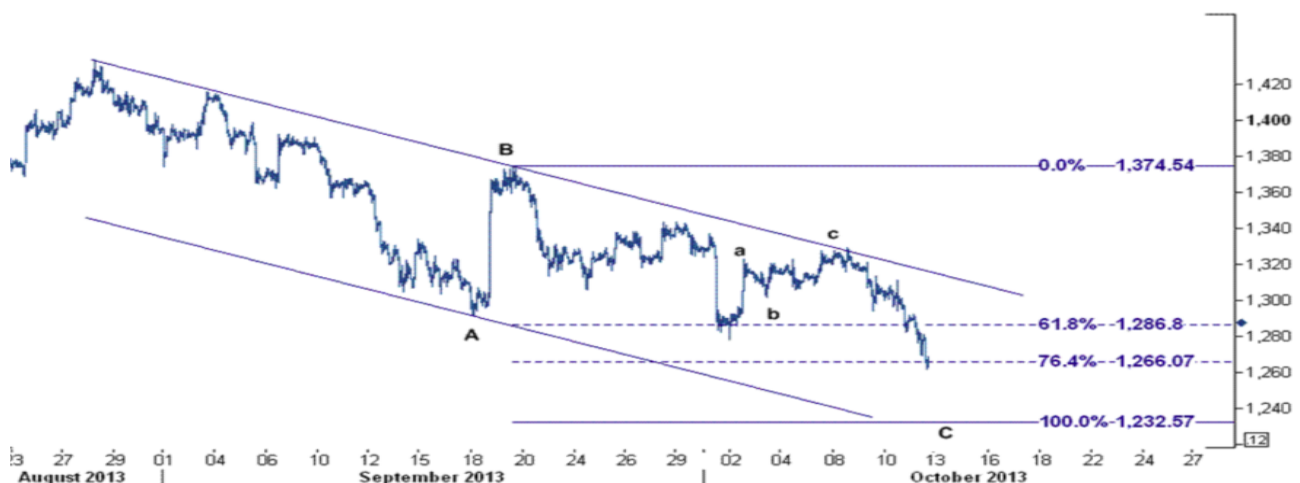
نمودار روند تغییرات ۱ ساعته قیمت جهانی اونس طلا