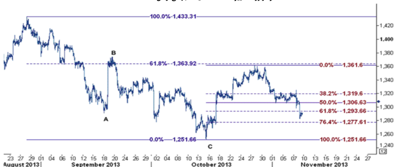
نمودار روند تغییرات ۱ ساعته قیمت جهانی اونس طلا