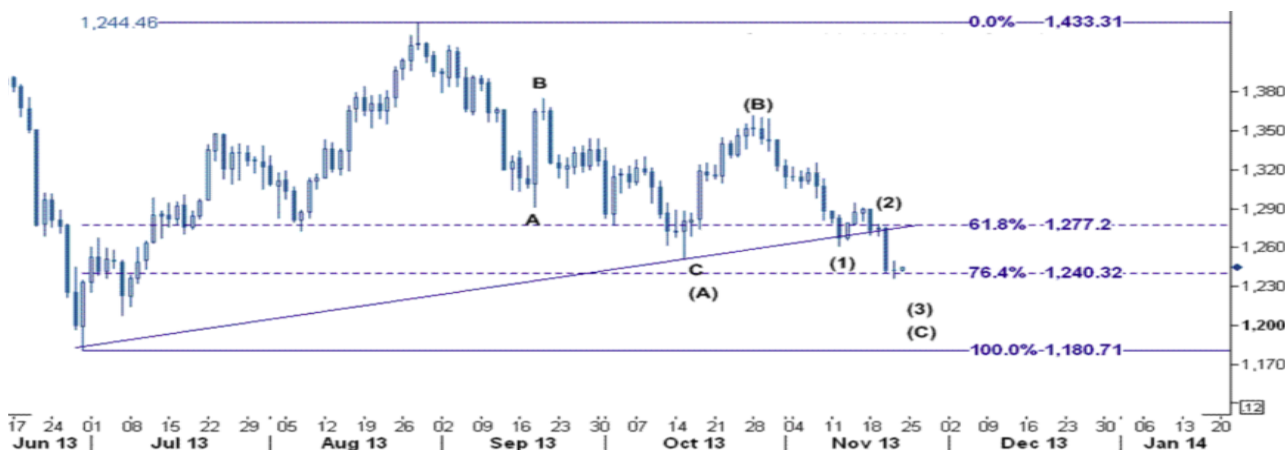
نمودار روند تغییرات روزانه قیمت جهانی اونس طلا