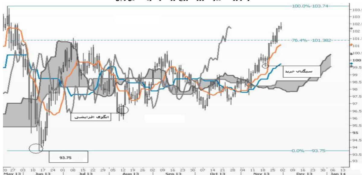
نمودار روند تغییرات روزانه زوج ارز دلار آمریکا - ین ژاپن