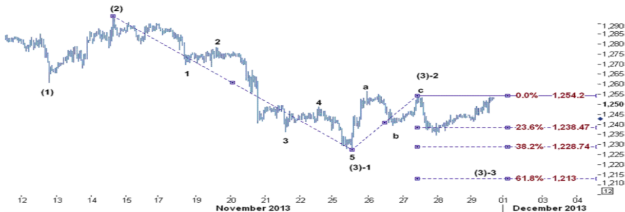
نمودار روند تغییرات ۱ ساعته قیمت جهانی اونس طلا