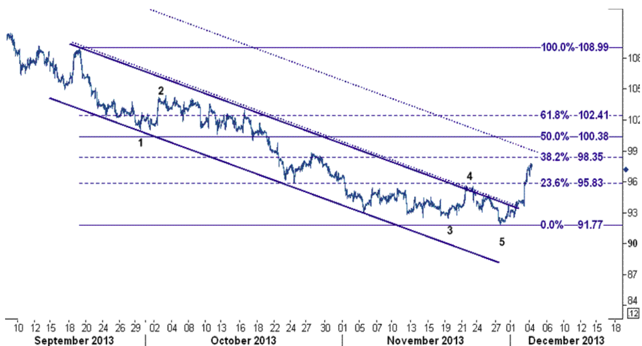
نمودار روند تغییرات ۱ ساعته قیمت نفت خام سبک آمریکا

با توجه به تصویر زیر می بینید که قیمت نفت بعد از برخورد و شکست سقف تونل واکنش نشان داده و شروع به افزایش به سوی خط روند رسم شده کرده است. لذا توصیه می شود معامله گران بیشتر دقت کنند و احتمال تقویت قیمت نفت را در دستور کار داشته باشند.