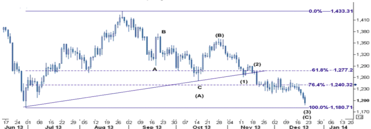
نمودار روند تغییرات روزانه قیمت جهانی اونس طلا