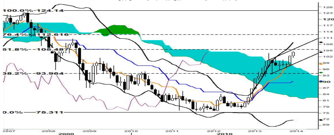
نمودار روند تغییرات ماهیانه زوج ارز دلار آمریکا - ین ژاپن

دلیل این امر نیز مشهود است، بانک مرکزی اروپا (ECB) و انگلیس (BoE) حداکثر ممکن است نرخ بهره را ثابت نگاه دارند اما مواضع بانک مرکزی ژاپن حکایت از ادامه برنامه خرید اوراق قرضه دولتی دارد و این مسئله موجب بالاتر رفتن زوج یورو به ین و پوند - ین ژاپن می شود . به عبارتی نیرویی که این زوج ارزها را در این چند ماهه تا این حد قوی کرده همچنان پابرجاست و احتمال ادامه آن بسیار است . در زوج ارز دلار به ین ژاپن نیز هنوز قیمت آن به منطقه اشباع نرسیده و به نظر می رسد که این روند تا سطح ۱۰۵.۴۸ ( خط فیبوناچی ۶۱.۸ درصدی از ۱۲۴.۱۴ به ۷۵.۳۱) حفظ شود .