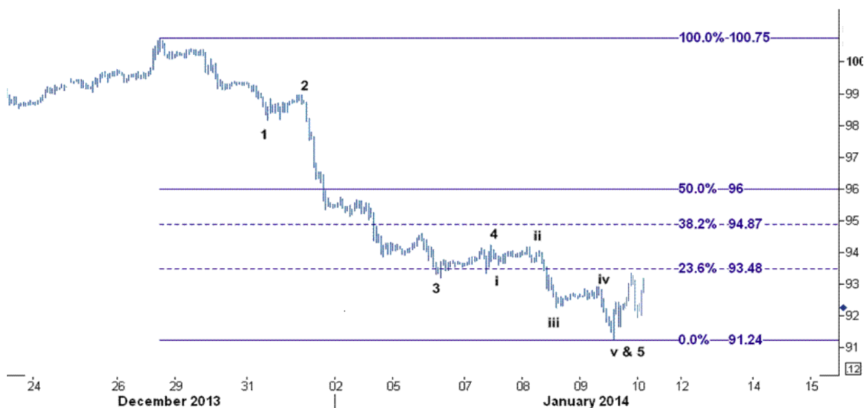
نمودار روند تغییرات ۱ ساعته قیمت نفت خام سبک آمریکا

ما هم اکنون از نظر تحلیل تکنیکال در منطقه اشباع از فروش برای قیمت نفت قرار داریم بطوریکه برای اولین بار از اوایل ماه نوامبر سال گذشته اندیکاتور RSI به زیر سطح ۳۰ رسیده است و بازار نفت آماده افزایش قیمت به ترتیب به سطوح ۹۳.۴۸ و ۹۴.۸۷ دلار/بشکه می باشد.