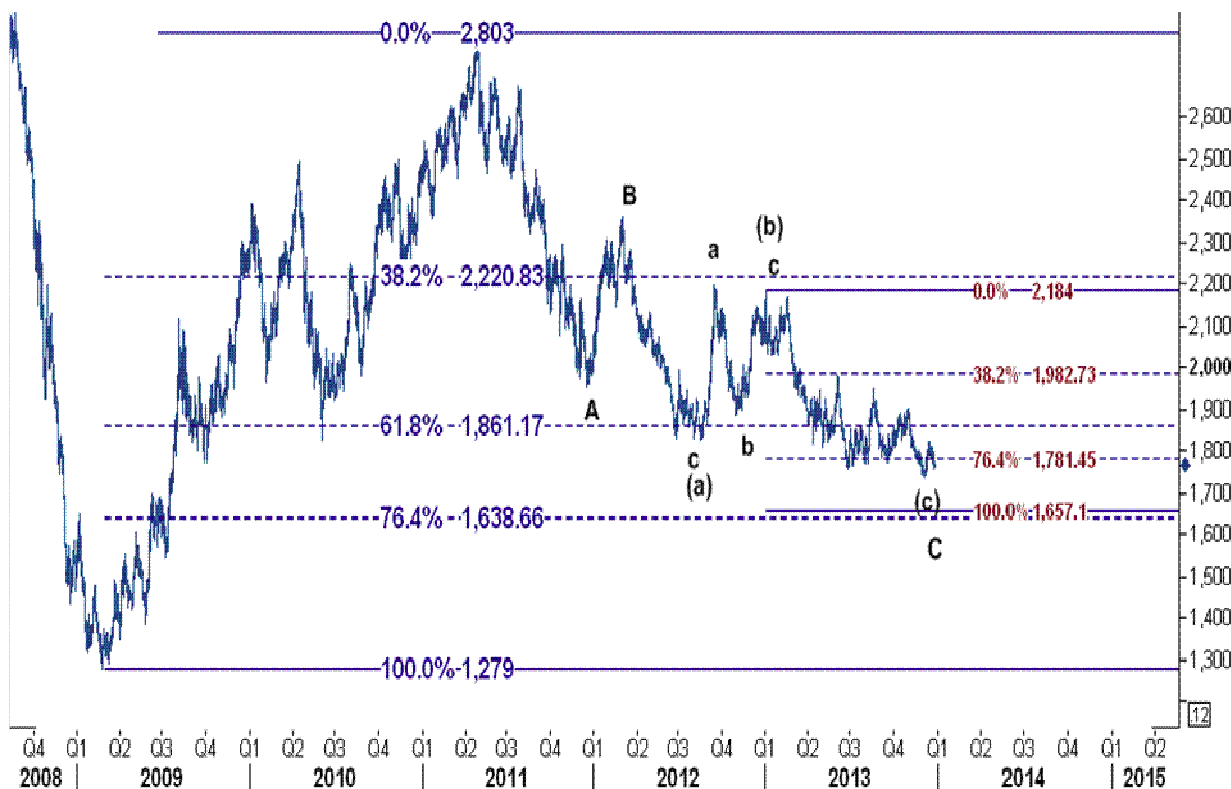
نمودار روند تغییرات روزانه قیمت جهانی هر تن آلومینیم آلیاژی در بازار بورس فلزات لندن

کاهش قیمت آلومینیوم با توجه به اینکه در بالا چشم انداز صعودی در مس را ترسیم کردیم در نگاه اول مشکوک به نظر می رسد زیرا این دو قرارداد در طول تاریخ بیشتر زمان، همبستگی قوی با یکدیگر داشته اند که باید منظور داشت.