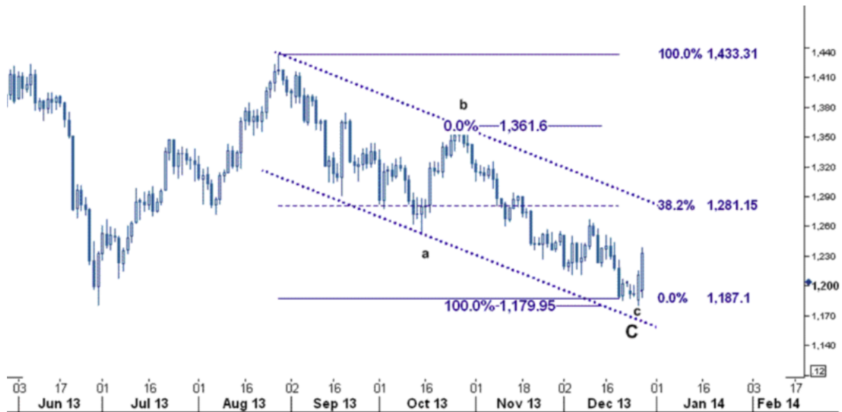
نمودار روند تغییرات ماهیانه قیمت جهانی اونس طلا