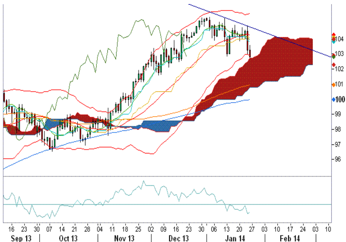
نمودار روند تغییرات روزانه زوج ارز دلار آمریکا - ین ژاپن

بعد از آن پیش بینی می کنیم که این منطقه حمایت مستحکم و قوی ۱۰۱.۰۰ حرکات بازار را تحت شعاع خود قرار دهد و این امکان وجود دارد که فروشندگان دلار با بستن پوزیشنهای فروش خود در نزدیکی منطقه ۱۰۱، زمینه برگشت قیمت زوج دلار- ین ژاپن را بیشتر فراهم کنند.