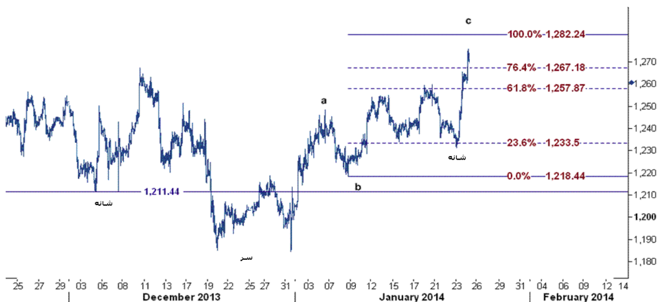
نمودار روند تغییرات ۱ ساعته قیمت جهانی اونس طلا