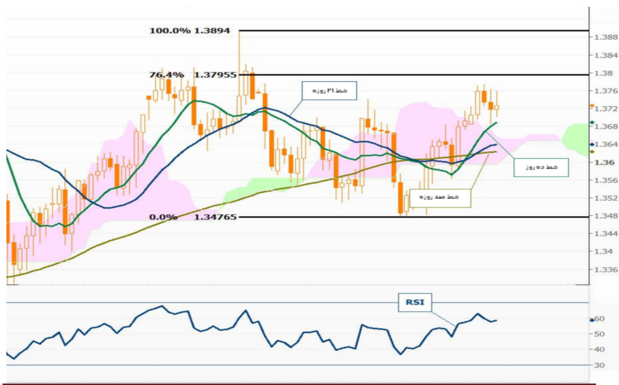
نمودار روند تغییرات روزانه زوج ارز یورو - دلار آمریکا

از این رو همچنان بر این باوریم که روند حرکت کماکان صعودی است و تحولات قیمت را با حرکت افزایشی دنبال می کنیم اما بدلیل چینش برخی از سفارشات فروش در منطقه نزدیکی ۱.۳۷۸۰ الی ۱.۳۸۰۰ بهتر است که در حول و حوش این منطقه از پوزیشن های خرید خارج شد زیرا سفارشات فروش به ترتیب در حوالی ۱.۳۷۸۰ و ۱.۳۸۰۰ با حد استاپ چند پیپ بالای سطح ۱.۳۸۲۰ قرار دارند .