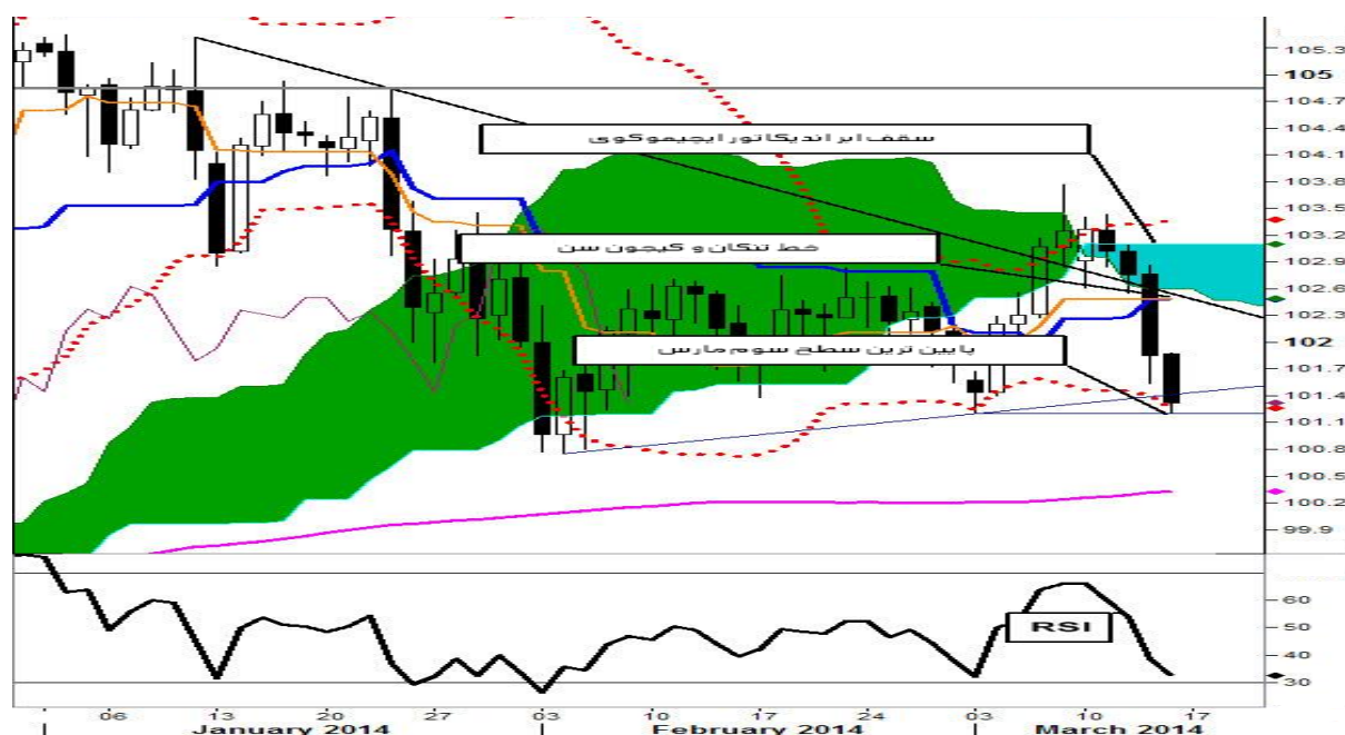
نمودار روند تغییرات روزانه زوج ارز دلار - ین ژاپن

در زوج ارز دلار - ین ژاپن پیشنهاد می کنیم که در هفته جاری در سطوح مقاومت ۱۰۲.۴۹ (کیجون و تنکان) و ۱۰۲.۶۰ (کف ابر ایچیموکوی روزانه) اقدام به گرفتن پوزیشن فروش نماید. سطوح حمایت مستحکمی بر روی نرخ ۱۰۱.۲۰ (پایین ترین سطح روز ۳ مارس ۲۰۱۴) و در ادامه سطوح ۱۰۱.۰۰ (کیجون سن هفتگی) و ۱۰۰.۸۰ (پایین ترین سطح روز ۶ فوریه) الی ۱۰۰.۷۶ (پایین ترین سطح روز ۴ فوریه ۲۰۱۴) تشکیل شده اند که مانع از ادامه کاهش شده اند. با این حال، اگر این سطوح شکسته شود، هدف بعدی، کاهش قیمت به سوی نرخهای ۱۰۰.۳۳ (خط میانگین متحرک ۲۰۰ روزه) و سقف ابر ایچیموکوی هفتگی (۹۸.۱۸) خواهد بود.