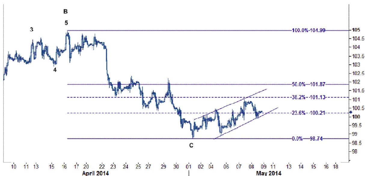
نمودار روند تغییرات ۱ ساعته قیمت نفت خام سبک آمریکا

به همین خاطر سطوح فعلی چندان جذابی برای ورود به پوزیشن را ندارد اما هرگونه کاهش قیمت به زیر سطح ۹۹.۸۰ می تواند زمینه برای ورود به پوزیشن فروش نفت خام سبک آمریکا با هدف ۹۸.۷۴ دلار/بشکه را فراهم کند که در نمودار زیر مشاهده می فرمائید.