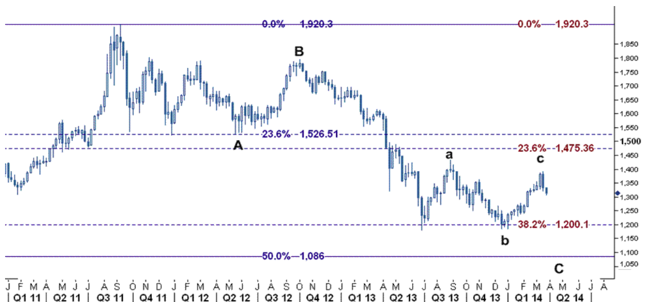
نمودار روند تغییرات هفتگی قیمت جهانی اونس طلا