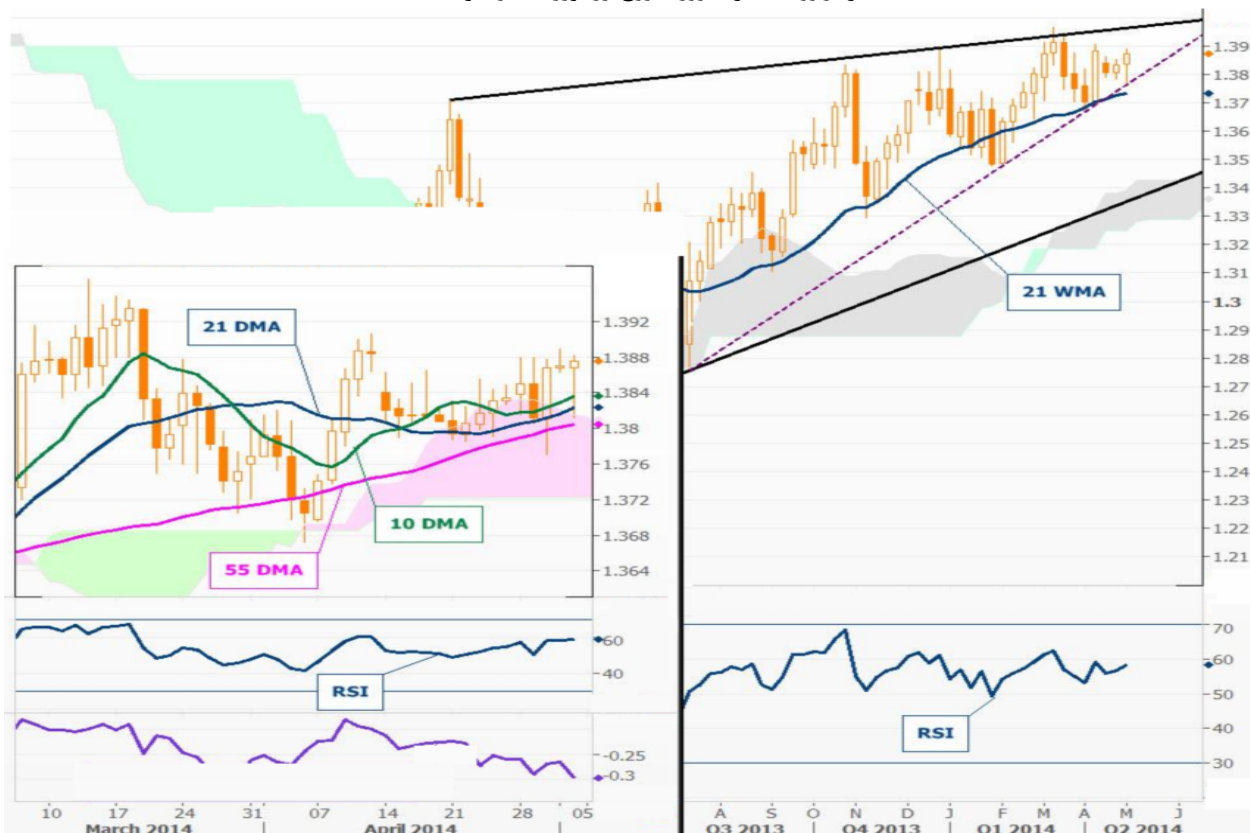
نمودار روند تغییرات روزانه زوج ارز یورو - دلار آمریکا