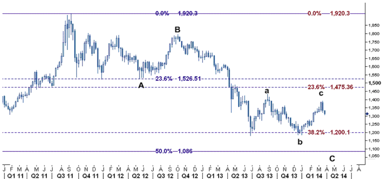
نمودار روند تغییرات هفتگی قیمت جهانی اونس طلا