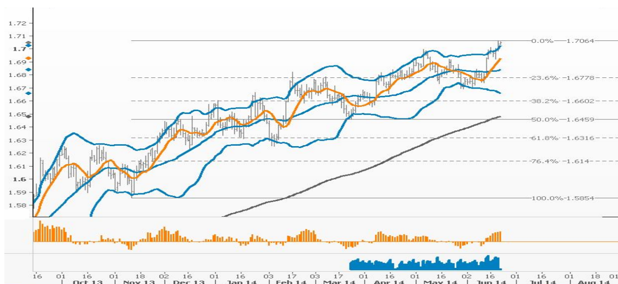
نمودار روند تغییرات روزانه زوج ارز پوند - دلار آمریکا

مسئله مهم دیگر پوند است. پوند با رسیدن به بالای سطح ۱.۷۰ فاصله خود را با عدد ۱.۷۱ بسیار کم کرده است. چند روز گذشته که در همین ستون صحبت از پوند ۱.۷۰ می کردیم بسیاری آن را یک دید اغراق گرایانه می دانستند اما گذشت زمان اثبات کرد که اینگونه نیست. در زوج ارز پوند - دلار نیز اگر در هفته جاری قیمت به همین صورت به روند افزایشی خود ادامه دهد، حرکت افزایشی با شدت بیشتر صورت خواهد گرفت و همچنین، پس از آنکه در معاملات هفته گذشته آمارهای اقتصادی مهم و مثبتی در انگلیس منتشر گردید، احتمال افزایش نرخ بهره و اعمال سیاستهای انقباضی از سوی بانک مرکزی انگلیس (BoE) در سه ماهه چهارم سال جاری بیشتر گردیده است. همین امر و گمانه زنی ها پیرامون بالا رفتن نرخ بهره انگلیس به افزایش چشمگیر پوند به بالاترین سطح ۷ ساله گذشته کمک کرده است و افزایش اختلاف بازدهی نرخ اوراق قرضه ۲ ساله انگلیس با نرخ بازدهی اوراق قرضه ۲ ساله آمریکا یکی دیگر از عوامل اصلی رشد پوند در برابر دلار می باشد. بنابراین همچنان در انتظار استمرار حرکت صعودی زوج پوند- دلار هستیم اما برای این کار می بایست سطح مقاومت ۱.۷۰۶۴ با قدرت شکسته شود تا راه برای صعود بیشتر و حرکت به سطوح ۱.۷۱۰۰، ۱.۷۲۰۰، ۱.۷۳۳۱ و ۱.۷۵۰۰ هموارتر گردد. سطوح حمایت پوند نیز به ترتیب در ۱.۷۰۰۰، ۱.۶۹۹۰، ۱.۶۹۷۵، ۱.۶۹۵۰ و ۱.۶۹۲۰ قرار دارند.