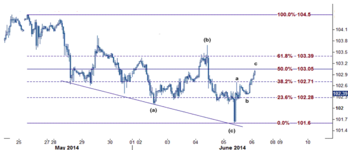
نمودار روند تغییرات ۱ ساعته قیمت نفت خام سبک آمریکا

از سوی دیگر اعلام محرک های مالی جدید بانک مرکزی اروپا همه و همه، خریداران نفت را برای ادامه مسیر صعودی متقاعد خواهد کرد و در حرکت نزولی با توجه به کاهش تنش در روابط اوکراین و روسیه، سطح حمایت بر روی نرخ ۱۰۱.۶۰ قرار دارد و فروشندگان برای ادامه کاهش با دشواریهایی مواجه هستند و به باور ما تنها شکست سطح حمایت ۱۰۱.۶۰ دلار/بشکه منجر به کاهش قیمت نفت خام سبک می شود.