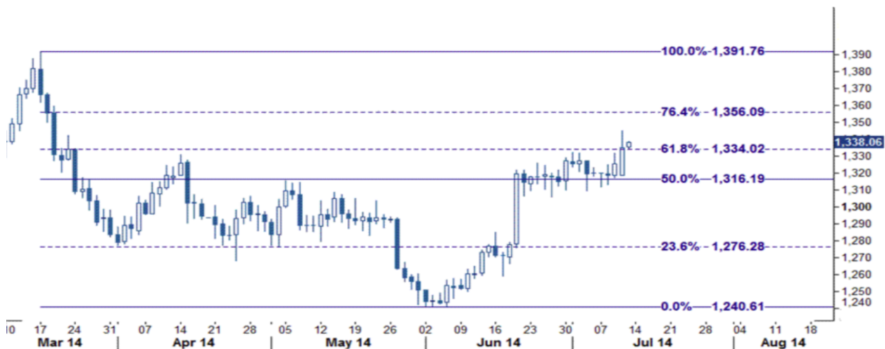
نمودار روند تغییرات روزانه قیمت جهانی اونس طلا