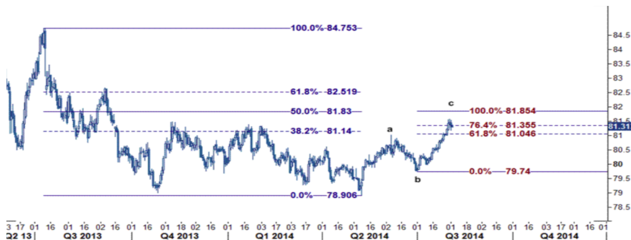
نمودار روند تغییرات روزانه شاخص جهانی ایندکس دلار آمریکا

در حال حاضر، بهترین استراتژی در جفت ارز یورو - دلار، فروش قیمت در محدوده نرخهای مقاومت ۱.۳۴۳۰، ۱.۳۴۴۵، ۱.۳۴۵۰، ۱.۳۴۶۰، ۱.۳۴۷۰، ۱.۳۴۹۰ و ۱.۳۵۰۰ و خرید در سطوح ۱.۳۳۳۰، ۱.۳۳۲۰ و ۱.۳۳۰۰ است. اکنون این احتمال قوی وجود دارد که پس از انجام یک حرکت اصلاحی یورو، بار دیگر شاهد ادامه روند نزولی باشیم. یورو بدلیل اختلاف در بازارهای نرخ بهره اروپا - آمریکا در سراسری سقوط قرار گرفته است و می بایست به این سقوط تن دهد!