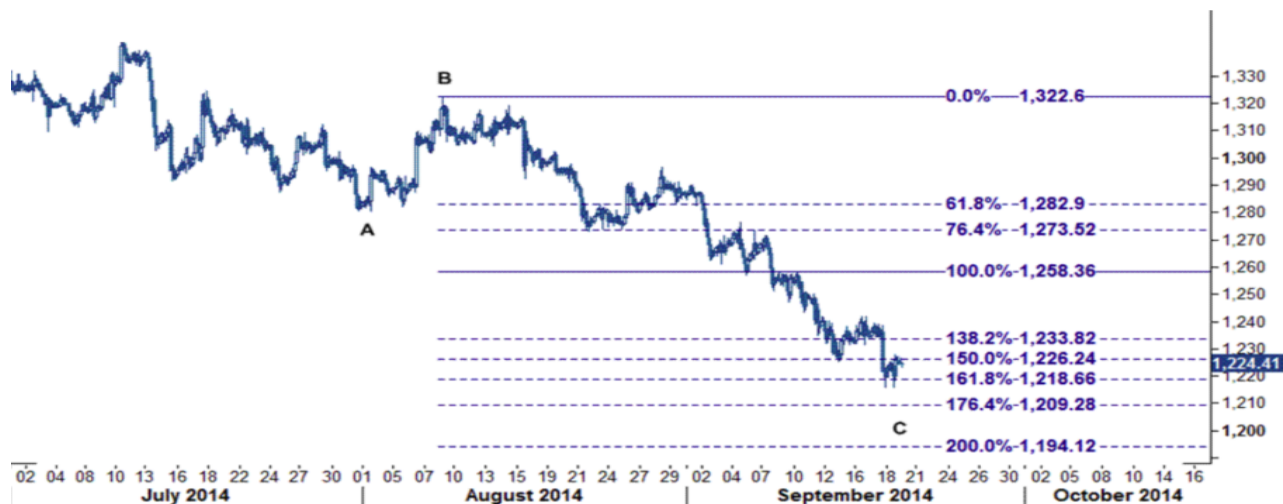
نمودار روند تغییرات ۱ ساعته قیمت جهانی اونس طلا

مقاومت قیمت نیز بر روی ۱۲۲۶ (خط فیبوناچی ۱۵۰ درصدی) و سپس ۱۲۳۳ (خط فیبوناچی ۱۳۸.۲ درصدی) قرار دارند. اکنون باز هم به سناریوی قبلی خود بازمی گردیم. سطوح ۱۲۲۶ و ۱۲۳۳ نقش مقاومت بسیار قوی را بازی می کنند که احتمال می دهیم از این محدوده شاهد بازگشت و ادامه روند کاهشی باشیم. در این صورت با شکسته شدن سطح ۱۲۱۳ اولین هدف نرخ ۱۲۰۹ و هدف بعدی نرخ ۱۱۹۴ خواهد بود که این سطوح همانطور که در نمودار زیر مشخص است به ترتیب بر روی خط فیبوناچی ۱۷۶.۴ درصدی و ۲۰۰ درصدی قرار دارند.