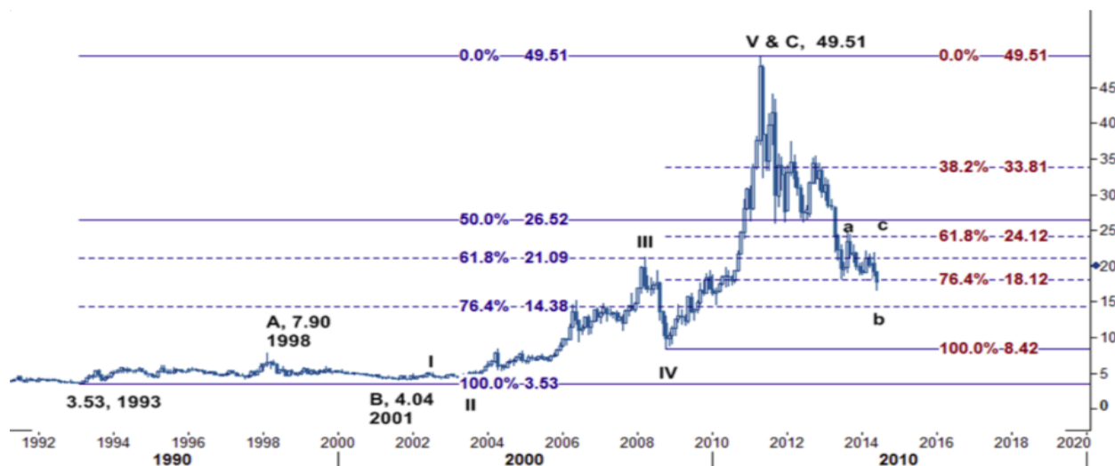
نمودار روند تغییرات ماهیانه قیمت جهانی اونس نقره

بدین جهت، پیش بینی هایی که برای کاهش قیمت جهانی اونس نقره وجود داشته است، هنوز هم معتبر به نظر می رسد و با توجه به اینکه اونس نقره در زیر سطوح حمایت ۲۱.۰۹ و ۱۸.۱۲ تثبیت شده ممکن است قیمت آن در کوتاه مدت و میان مدت به سوی سطح ۱۷ و سپس ۱۴.۳۸ (خط فیبوناچی ۷۶.۴ درصدی از ۳.۵۳ - پایین ترین سطح سال ۱۹۹ - به ۴۹.۵۱ - بالاترین سطح آوریل ۲۰۱۱) کاهش یابد.