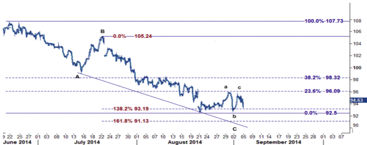
نمودار روند تغییرات ۱ ساعته قیمت نفت خام سبک آمریکا

بررسی سطوح فیبوناچی از کاهش ۱۰۵.۲۵ (بالا ترین سطح روز ۲۲ جولای) به ۹۲.۵۰ سطح مقاومت قیمت را بر روی ۹۶.۰۹ نشان می‌دهد که این سطح محل برخورد قیمت به سطح ۲۳.۶ درصدی می‌باشد و برای هفته جاری تنها به شرط آنکه این سطح شکسته شود زمینه را برای استمرار حرکت برگشتی به سوی سطح ۹۸.۳۲ (خط فیبوناچی ۳۸.۲ درصدی) فراهم می‌آورد در غیر این صورت می‌بایست منتظر کاهش قیمت نفت خام تا ۹۳.۱۹ و ۹۱.۱۳ دلار/بشکه باشیم.