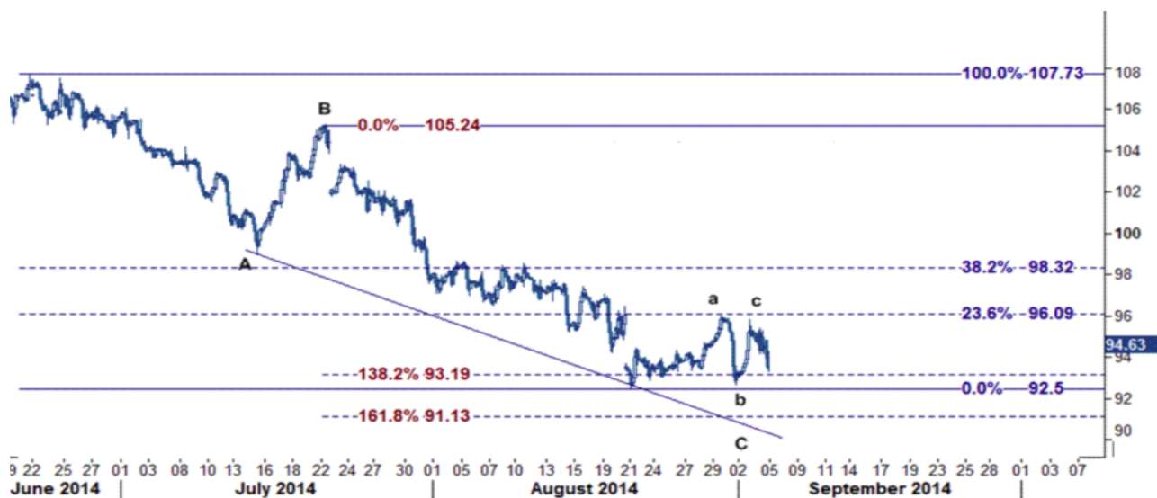
نمودار روند تغییرات ۱ ساعته قیمت نفت خام سبک آمریکا

بررسی سطوح فیبوناچی از کاهش ۱۰۵.۲۵ (بالاترین سطح روز ۲۲ جولای) به ۹۲.۵۰ سطح مقاومت قیمت را بر روی ۹۶.۰۹ نشان می‌دهد که این سطح محل برخورد قیمت به سطح ۲۳.۶ درصدی می‌باشد و برای ماه جاری تنها به شرط آنکه این سطح شکسته شود زمینه را برای استمرار حرکت برگشتی به سوی سطح ۹۸.۳۲ (خط فیبوناچی ۳۸.۲ درصدی) فراهم می‌آورد در غیر این صورت می‌بایست منتظر کاهش قیمت نفت خام تا ۹۳.۱۹ و ۹۱.۱۳ دلار/بشکه باشیم.