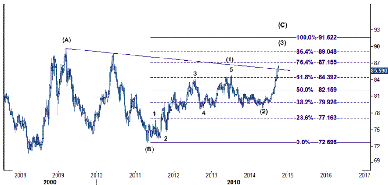
نمودار روند تغییرات هفتگی قیمت جهانی شاخص دلار آمریکا