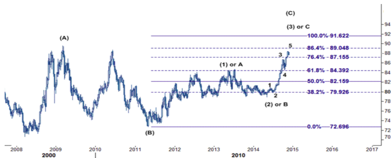
نمودار روند تغییرات روزانه قیمت جهانی ایندکس دلار آمریکا