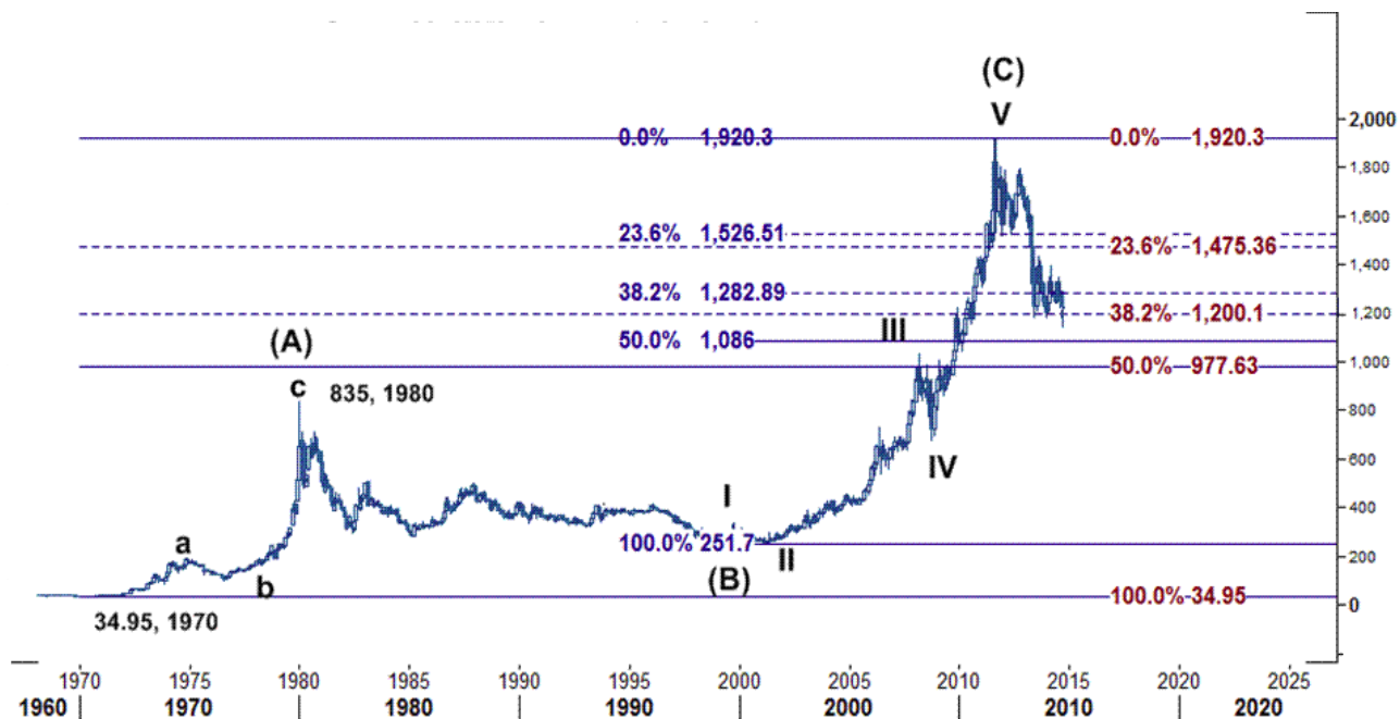
نمودار روند تغییرات ماهیانه قیمت جهانی اونس نقره