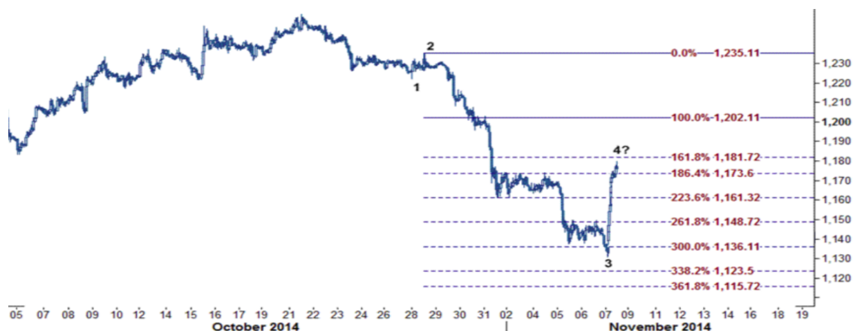
نمودار روند تغییرات ۱ ساعته قیمت جهانی اونس طلا