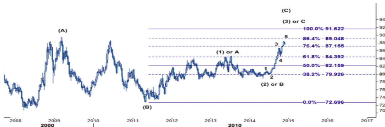
نمودار روند تغییرات روزانه قیمت جهانی ایندکس دلار آمریکا