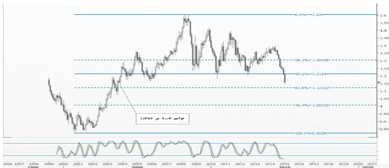
نمودار روند تغییرات تایم فریم روزانه جفت ارز دلار استرالیا - دلار آمریکا