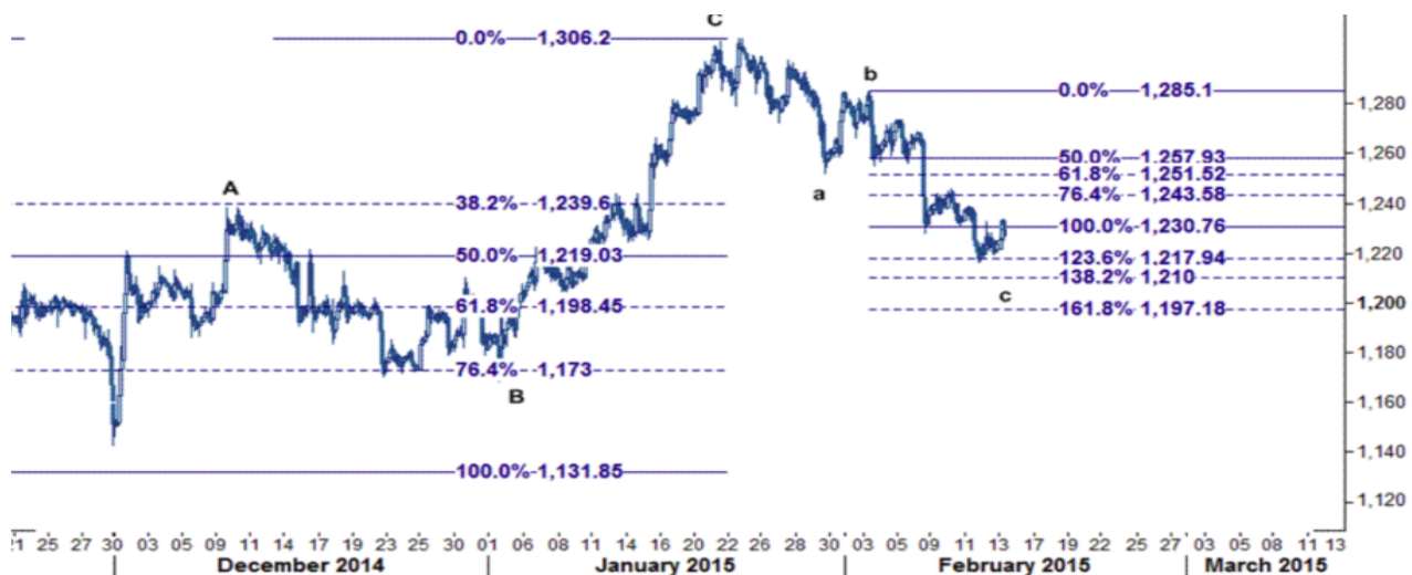
نمودار روند تغییرات تایم فریم ۱ ساعته قیمت جهانی اونس طلا