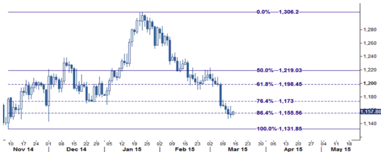
نمودار روند تغییرات تایم فریم روزانه قیمت جهانی اونس طلا