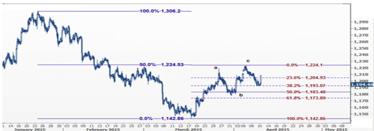
نمودار روند تغییرات تایم فریم ۱ ساعته قیمت جهانی اونس طلا