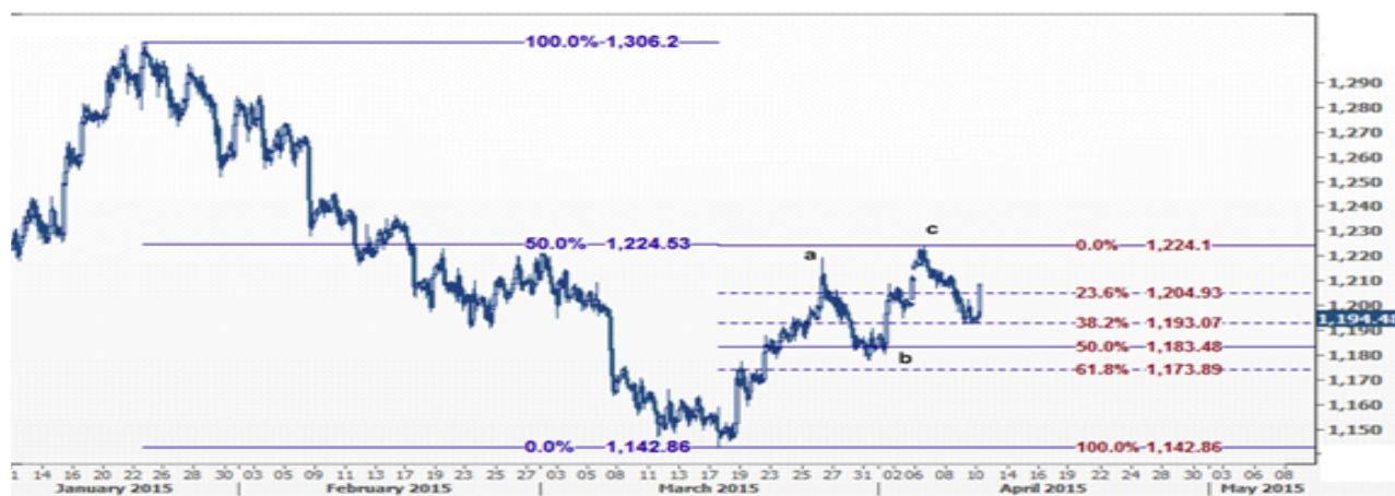
نمودار روند تغییرات تایم فریم ۱ ساعته قیمت جهانی اونس طلا