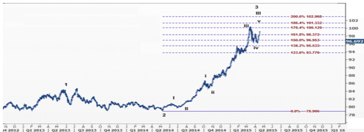
نمودار روند تغییرات روزانه قیمت جهانی ایندکس دلار آمریکا