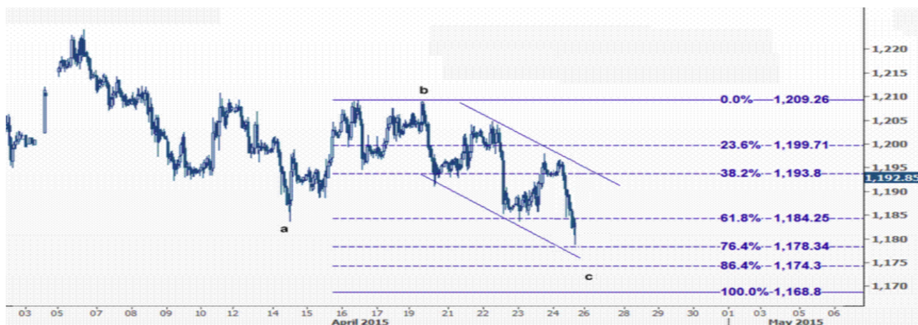
نمودار روند تغییرات تایم فریم ۱ ساعته قیمت جهانی اونس طلا