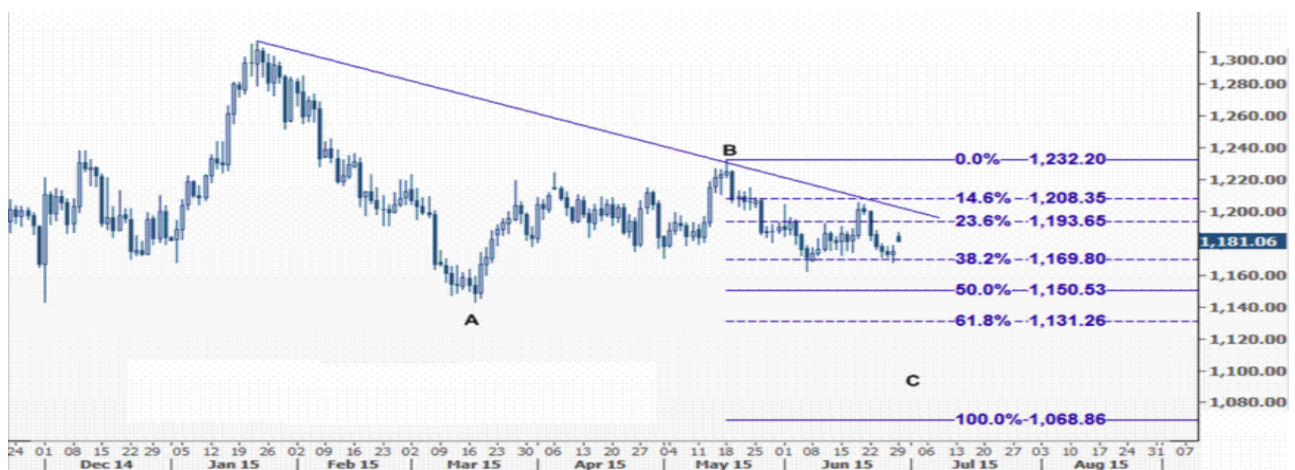
نمودار روند تغییرات تایم فریم ۱ ساعته قیمت جهانی اونس طلا