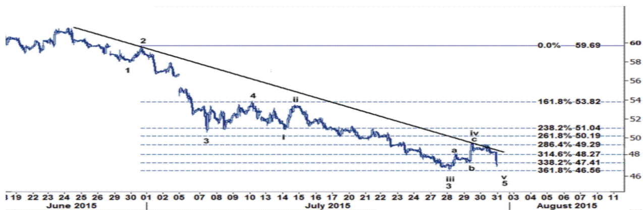
نمودار روند تغییرات تایم فریم ۱ ساعته قیمت نفت خام سبک آمریکا

از منظر تحلیل فاندامنتال نیز لازم به ذکر است قیمت نفت در ماه جولای به میزان ۲٪- کاهش یافت که شدیدترین کاهش قیمت نفت از سال ۲۰۰۸ به این سو است که عمده ی دلیل آن را می توان به افزایش عرضه نفت توسط اعضای اوپک و کشورهای غیرعضو، ادامه کاهش رشد اقتصاد جهانی، محقق نشدن رشد پیش بینی شده برای اقتصادهای نوظهور، افزایش ارزش دلار آمریکا، رکورد استخراج نفت کشورهای خاورمیانه و آمارهای ضعیف اقتصادی چین اشاره نمود.