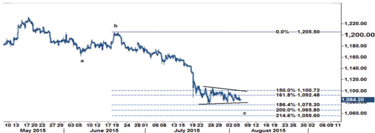
نمودار روند تغییرات تایم فریم ۱ ساعته قیمت جهانی اونس طلا