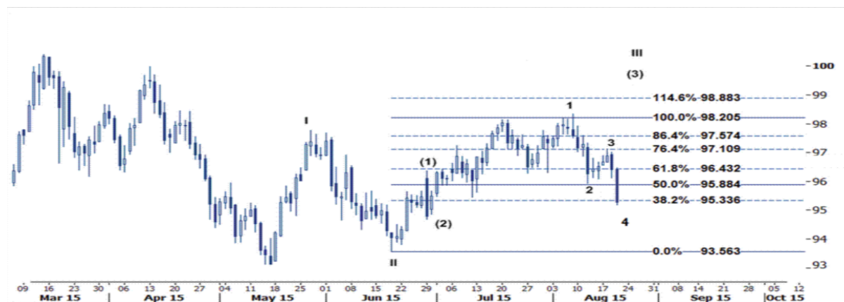
نمودار روند تغییرات تایم فریم روزانه قیمت جهانی ایندکس دلار آمریکا

اکنون با تغییر در تمایلات بازار و با افزایش نگرانی از کاهش رشد اقتصادی چین و نگرانی ها از کاهش رشد اقتصاد جهانی و همچنین کم رنگ تر شدن انتظارات بازار از افزایش نرخ بهره بانک فدرال رزرو در ماه سپتامبر یکبار دیگر شاهد ظهور فشارهای نزولی بر ایندکس دلار آمریکا هستیم و همانطور که در چارت پایین مشخص است قیمت توانسته است به زیر سطوح ۹۵.۳۳ (خط فیبوناچی ۳۸.۲ درصدی) و ۹۵.۰۰ کاهش یابد و با سطح حمایت ۹۴.۶۰ مواجه است. دلار کانادا نیز از جمله ارزهایی بود که در هفته گذشته در برابر دلار آمریکا به میزان قابل توجهی تضعیف شد. به نظر می رسد با بازگشت توجهات به مسله کاهش نرخ بهره بانک مرکزی کانادا (BOC) و کاهش شدید قیمت نفت خام سبک آمریکا و برنت دریای شمال در بازارهای جهانی، زوج ارز USDCAD مجدداً خیز خود را برای حرکت به سمت اعداد بالاتر از ۱.۳۲ برداشته است.