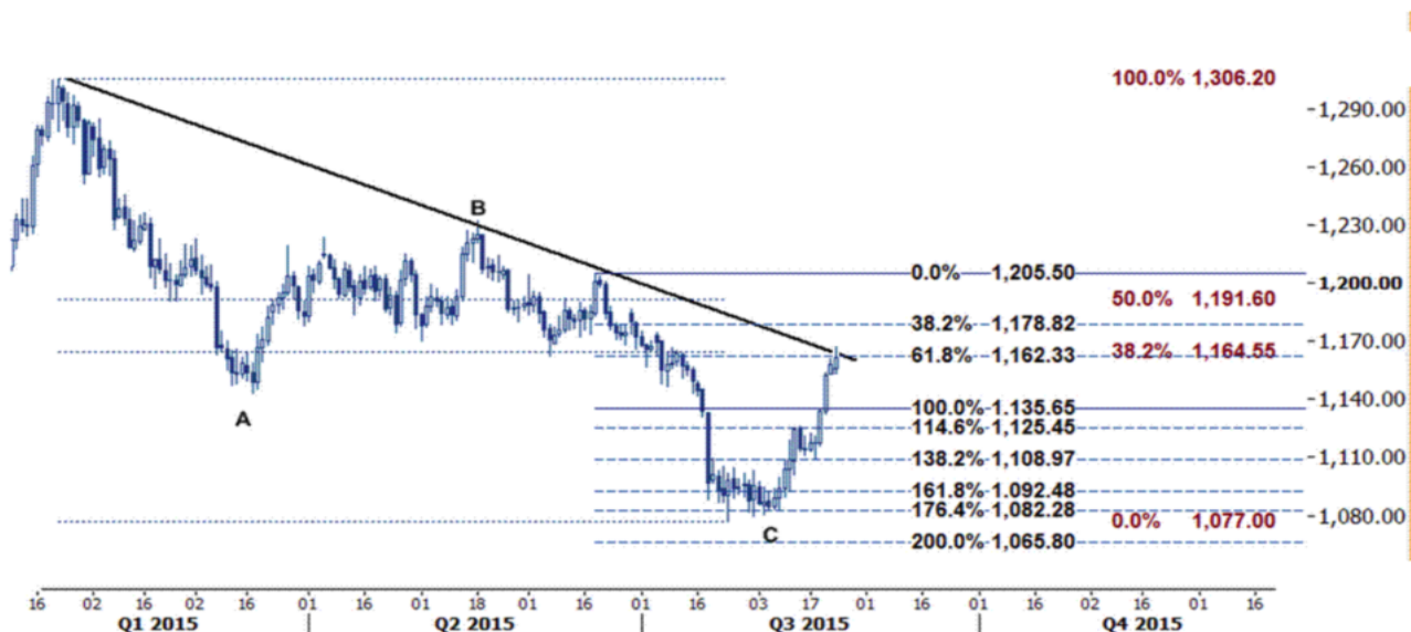
نمودار روند تغییرات تایم فریم روزانه قیمت جهانی اونس طلا

در خبری دیگر صندوق جهانی اسپایدر (SPDR) نیز هفته پیش اعلام نمود که ۳.۵۷ تن طلا به ذخایر خود اضافه کرده است و هم اکنون کل موجودی ذخایر طلای این صندوق سرمایه گذاری در حدود ۶۷۵.۴۴ تن است و برای هفته جاری ظاهراً همه چشمها به این خط روند برای اونس طلا دوخته شده است تا ببینیم با قدرت شکسته می شود یا نه.