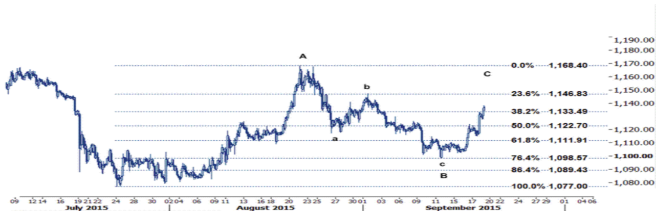
نمودار روند تغییرات تایم فریم ۱ ساعته قیمت جهانی اونس طلا