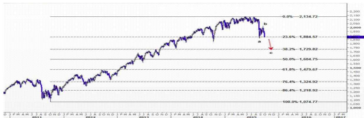
نمودار روند تغییرات تایم فریم روزانه شاخص سهام استاندارد اند پورز پانصد آمریکا

در نمودار زیر ادامه حرکت کاهشی سهام استاندارد اند پورز پانصد آمریکا را پیش بینی می کنیم. انتظار داریم این حرکت اصلاحی با توجه به اینکه وارونه شده است، می بایست در میان مدت در موج نزولی c منتظر فرود بیشتر قیمت سهام استاندارد اند پورز پانصد آمریکا به نرخهای پایین سطح ۱۸۸۴ باشیم و هدف بعدی را سطح ۱۷۲۹.۸۲ پیش بینی می کنیم که در چارت پایین دیده می شود.