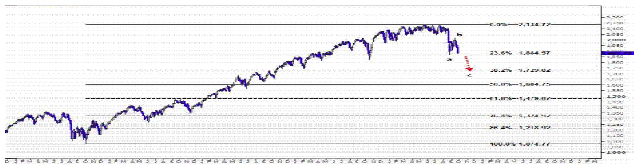
نمودار روند تغییرات تایم فریم روزانه شاخص سهام استاندارد اند پورز پانصد آمریکا

در نمودار زیر ادامه حرکت کاهشی سهام استاندارد اند پورز پانصد آمریکا را پیش بینی می کنیم. انتظار داریم این حرکت اصلاحی با توجه به اینکه وارونه شده است، می بایست در میان مدت در موج نزولی c منتظر فرود بیشتر قیمت سهام استاندارد اند پورز پانصد آمریکا به نرخهای پایین سطح ۱۸۸۴ باشیم و هدف بعدی را سطح ۱۷۲۹.۸۲ پیش بینی می کنیم که در چارت پایین دیده می شود.