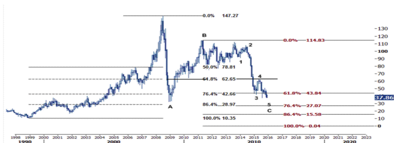
نمودار روند تغییرات تایم فریم ماهیانه قیمت نفت خام سبک آمریکا

بنابراین به نظر می رسد محدوده فعلی قیمت نفت موقعیت خوبی برای فروش نفت در میان مدت (طی ۱ الی ۳ ماهه) باشد و با در نظر داشتن حد استاپ در بالای سطوح مقاومت ۴۱.۴۳ و ۴۳.۸۴ می توان برای ورود به پوزیشن فروش به ترتیب با حد تارگت های ۳۵.۵۸ ، ۳۱.۹۵ و پس از آن سطوح ۲۸.۹۷ و ۲۷.۰۷ دلار/بشکه تصمیم گرفت که این اهداف را در چارت ماهیانه و روزانه پایین مشاهده می کنید.