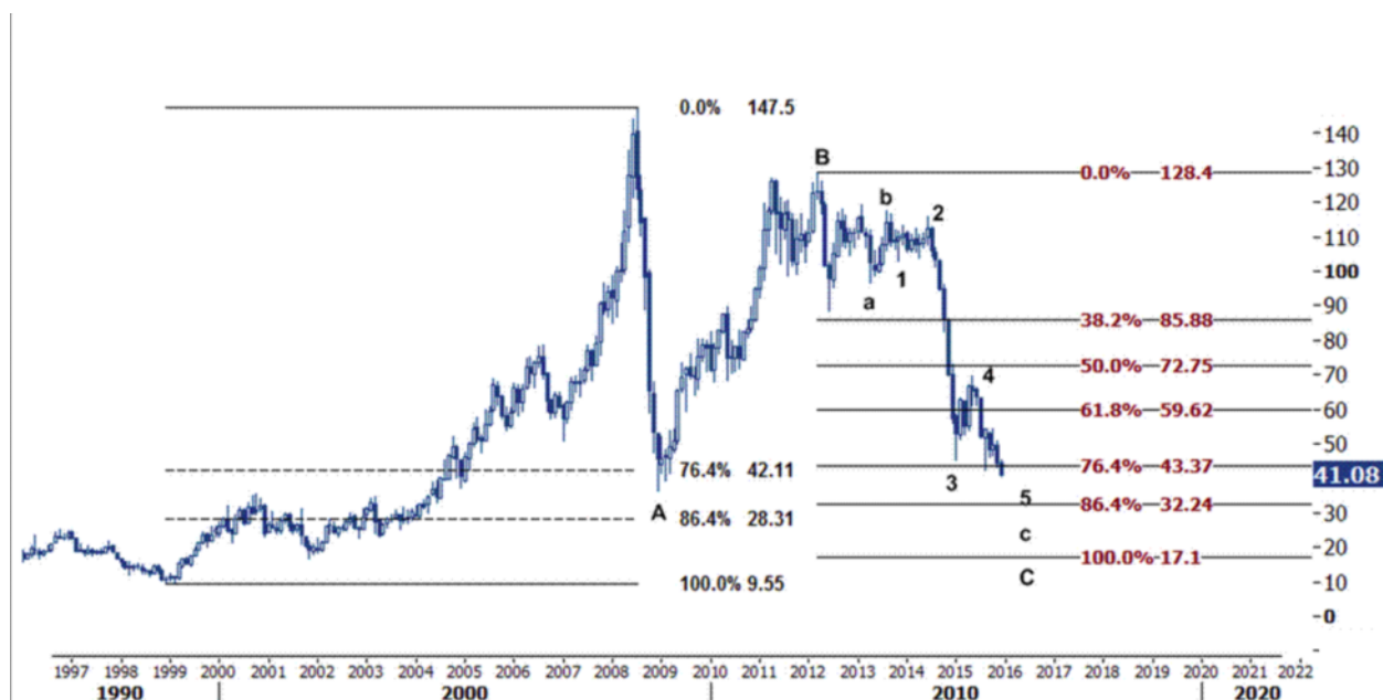
نمودار روند تغییرات تایم فریم هفتگی قیمت نفت برنت دریای شمال بازار لندن