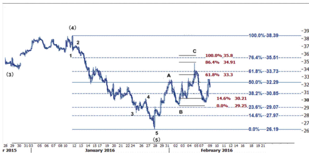
نمودار روند تغییرات تایم فریم ۱ ساعته قیمت نفت خام سبک آمریکا

همانطور که در چارت پایین مشخص است از آنجاییکه اکنون سطح حمایت ۳۰.۸۵ کاملاً شکسته شده است، حرکت قیمت نفت به سوی نرخهای ۳۰.۲۱ و ۲۹.۲۵ است که اگر این سطوح هم شکسته شوند، می باید به انتظار تسریع حرکت نزولی و رسیدن قیمت به نرخهای پایین تر به ترتیب به سطوح ۲۹.۲۵ و ۲۹.۰۷ دلار/بشکه باشیم که این اهداف در چارت پایین مشخص هستند.