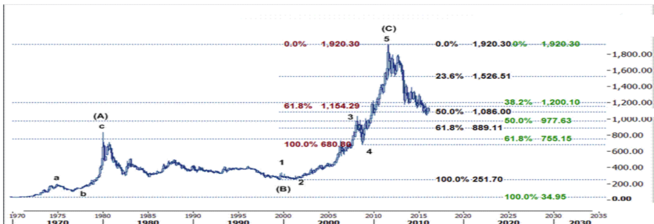
نمودار روند تغییرات تایم فریم ماهیانه قیمت جهانی اونس طلا